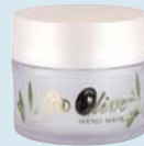
Olive Hand Mask