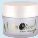
Olive Hand Peeling