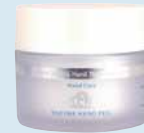
Enzym Hand Peel